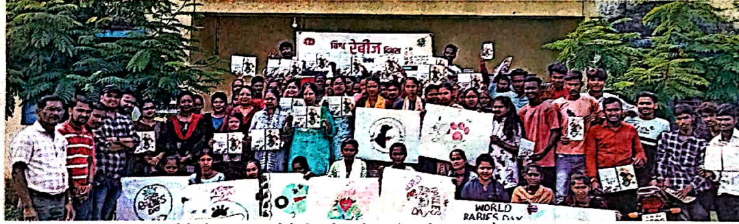
भाटापारा। विश्व रेबीज दिवस पर लोगों को जागरूक करने के लिए पोस्टर के प्रदर्शन करते हुए छात्र और स्टाफ।